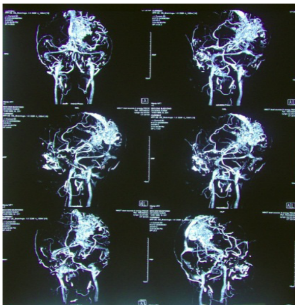
Gambar 1 CT Angiografi Menunjukkan Massa Vaskular di Regioparietooksipital Kiri

Relaksasi otak, kontrol hemodinamik otak dan sistemik pada pasien dapat melalui beberapa teknik. Untuk relaksasi otak pada pasien ini diberikan mannitol 1 g/kgBB selama 30 menit sebelum duramater dibuka, kepala diposisikan anti-Trendelenburg untuk menunjang drainase vena intrakranial, dengan target PCO_2 35–40 mmHg. Tekanan perfusi serebral dipertahankan optimal selama manipulasi intrakranial dengan mentitrasi penggunaan propofol dan anestesia